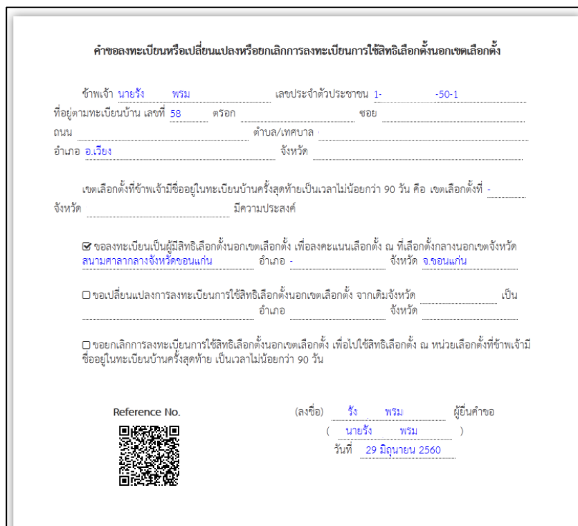
รูปที่ ๔ หน้าจอแสดงเอกสารคำขอลงทะเบียน/เปลี่ยนแปลง/ยกเลิกการลงทะเบียนการใช้สิทธิเลือกตั้งนอกเขตเลือกตั้ง

๓. เมื่อเสร็จสิ้นการลงทะเบียน ระบบจะแสดงเอกสารการลงทะเบียนขอใช้สิทธิเลือกตั้งนอกเขตเลือกตั้ง ซึ่งประชาชนสามารถสั่งพิมพ์ออกทางเครื่องพิมพ์เพื่อเก็บไว้เป็นหลักฐานในการลงทะเบียนได้ ดังรูป